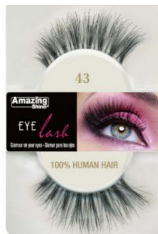
Amazing Shine 43