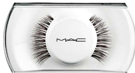
M.A.C Cosmetics Lash 36