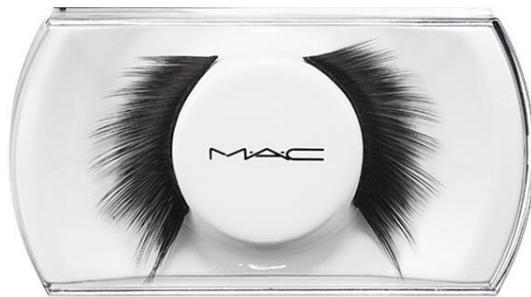
M.A.C Cosmetics Lash 42