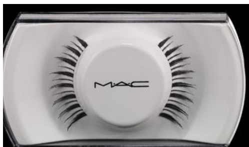
M.A.C Cosmetics Lash 7