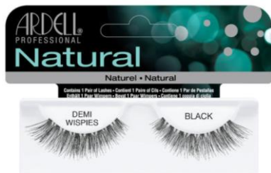
Ardell Demi Wispies