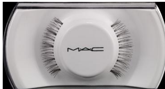
M.A.C Cosmetics Lash 31