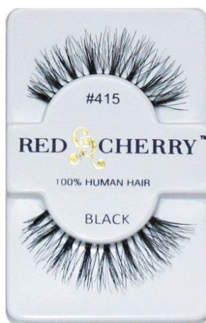
Red Cherry 415