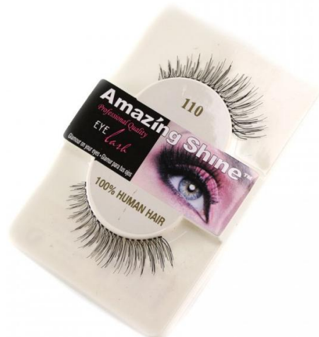
Amazing Shine Eye Lash/110