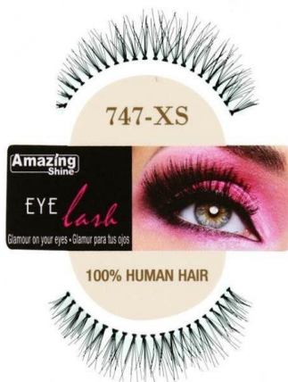
Amazing Shine Eye Lash/747XS