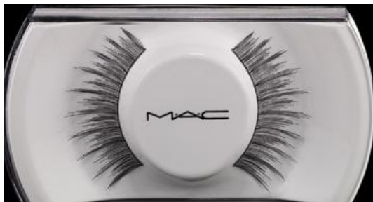
M.A.C Cosmetics Lash 2